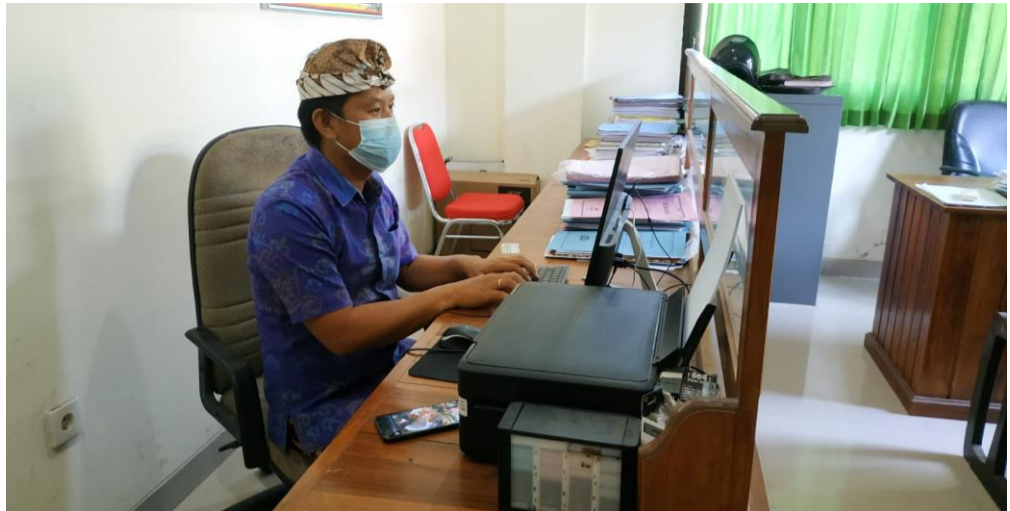
Foto: Pelaksanaan Pelayanan Perijinan Terpadu Kecamatan (PATEN) di Kecamatan Nusa Penida