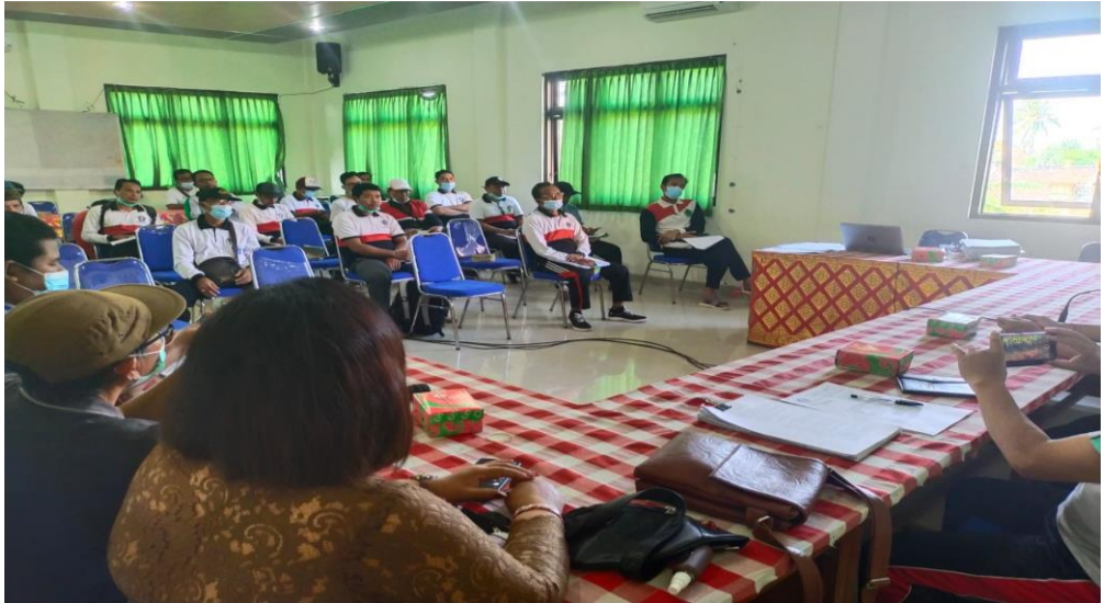
Foto: Kegiatan Penyelenggaraan Evaluasi APBDesa Tahun 2022 di Kecamatan Nusa Penida